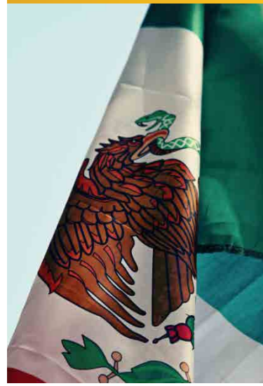
INDUSTRIA HOTELERA MEXICANA