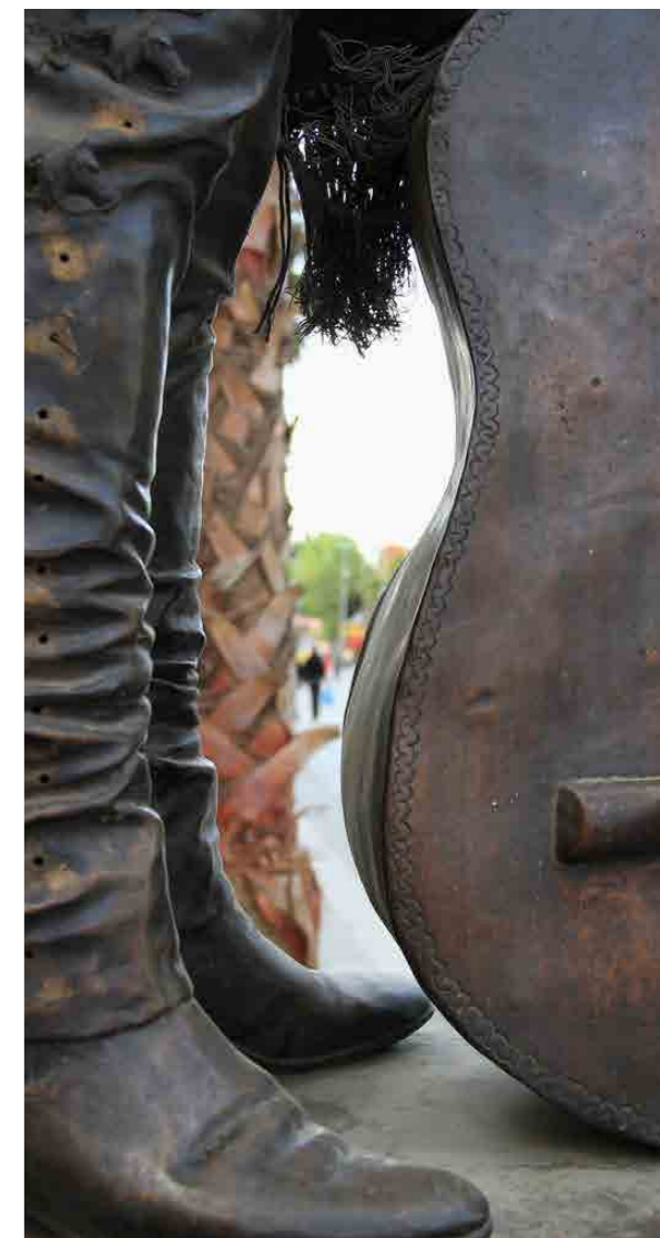
Plaza Garibaldi, Estatua Cirilo Marmolejo