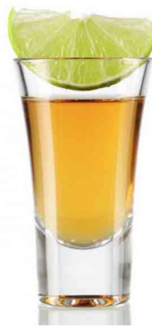
Disfruta del afamado "Tequila" bebida nacional.

Este lugar se ubicó en tiempos prehispánicos en el barrio de Cuepopan, uno de los cuatro que conformaban la gran ciudad lacustre de México-Tenochtitlan. A lo largo del Virreinato fue conocida como la Plazuela del Jardín, cuyo trazo aún no estaba definido.