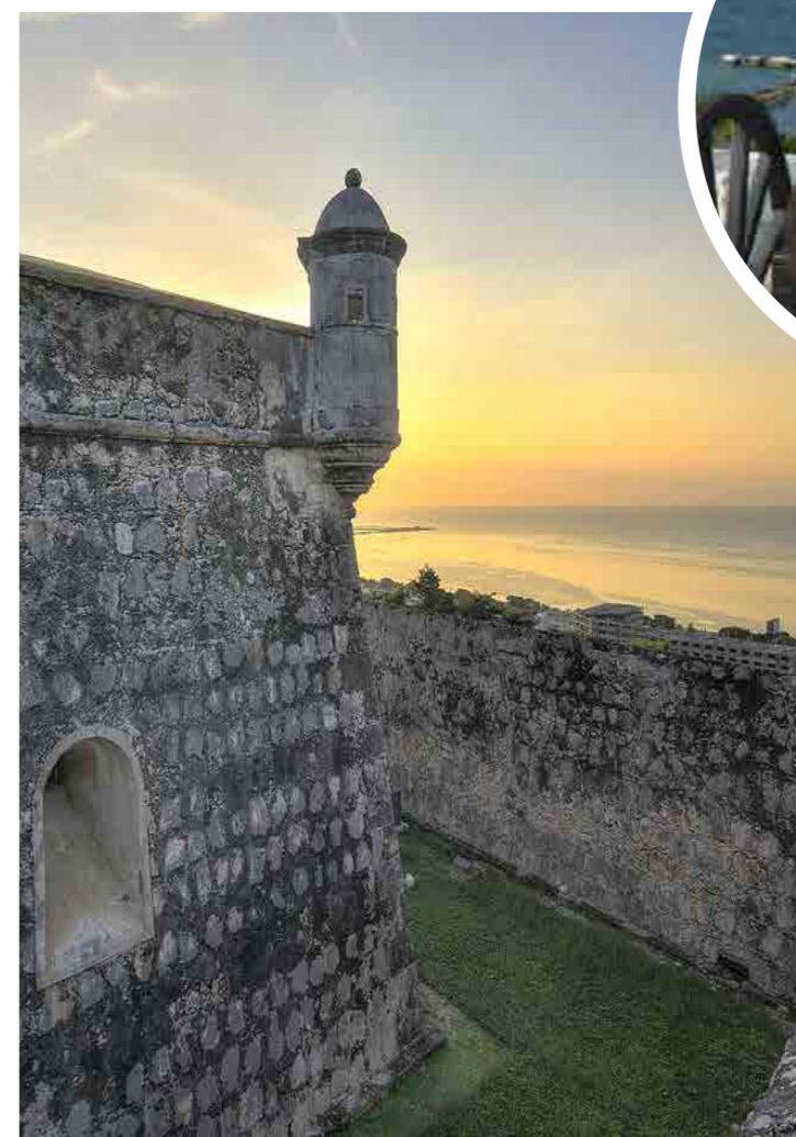
CIUDAD AMURALLADA DE CAMPECHE